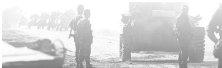
Русские танки в Цхинвали

ти, увидев на городских площадях в центре города, где до сих пор сохранился памятник Иосифу Сталину, как съезжались автобусы со всей Грузии с вооруженными людьми в военной форме. Автобусов были десятки, и все они были заполнены военными. Мне кажется, что там на площади собралось 3-4 тысячи военных, которых направляли на фронт воевать.